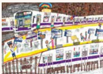
ふじい なぎな 藤井 椰生 3年・東京都