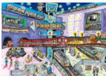
いわみ かおる 岩並 薫 4年・東京都