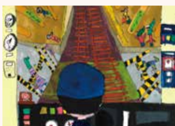
わたなべ はる 渡部 はる 2年・東京都