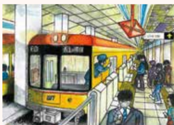
もりはた こうた 森畑 皓太 4年・千葉県