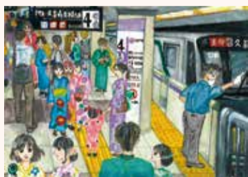
まさき ゆわ 正木 優和 5年・東京都