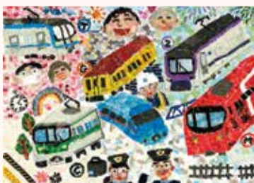
ゆきよし はるたか 雪吉 晴敬 5年・東京都