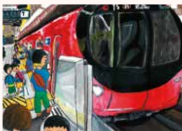
ひらせ はると 平瀬 悠翔 5年・東京都