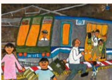
かのうち けいた 叶内 圭大 2年・千葉県