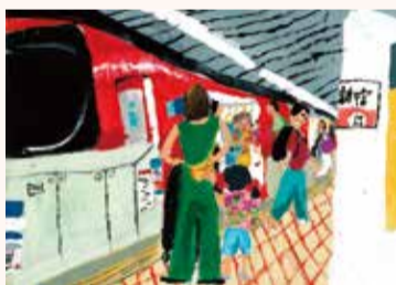
りゅうじん みずき 龍神 瑞 3年・東京都