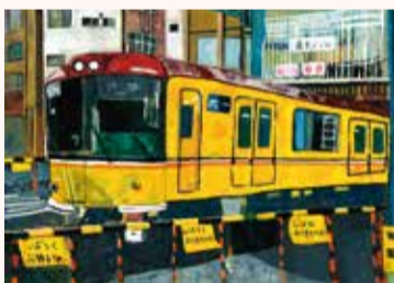
やまぐち さやか 山口 紗佳 3年・千葉県