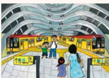
きたおか あゆみ 北岡 歩 2年・東京都