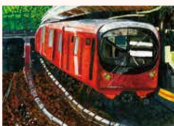
ちかがわ ゆり 近川 佑莉 3年・千葉県