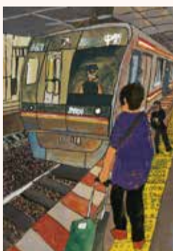
かねこ かりん 金子 嘉琳 2年・千葉県