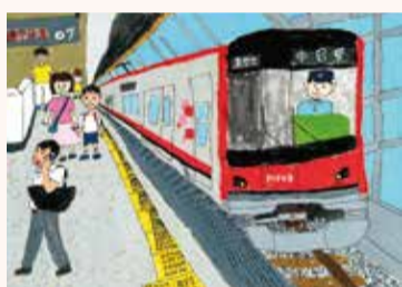
かきぬま ちひろ 柿沼 千聖 1年・東京都