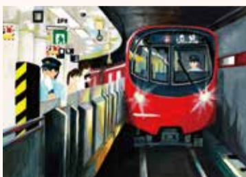
うえの かほ 上野 果歩 6年・東京都