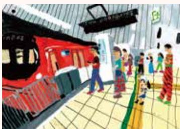
りゅうじん たまき 龍神 環 3年・東京都