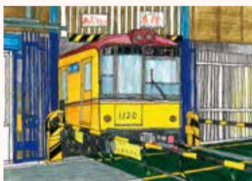
いけぶくろ たくみ 池袋 匠 4年・千葉県