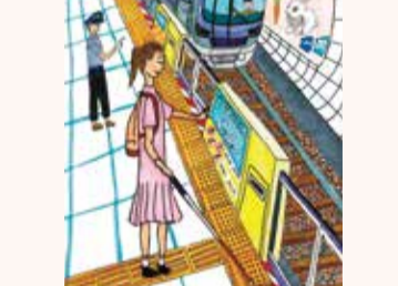
さくち あいり 菊地 あいり 5年・東京都