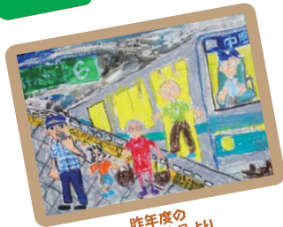
昨年度の 特選作品より