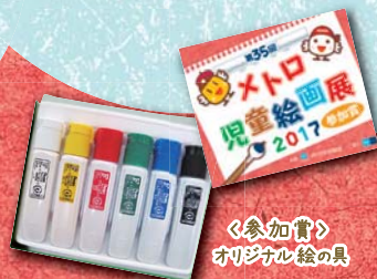
《参加賞》 オリジナル絵の具